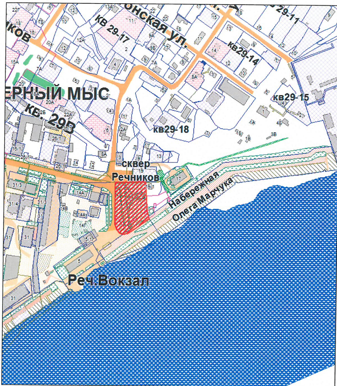
Схема расположения земельного участка под сквер "Речников" расположенного в п. Черный Мыс, в г. Сургуте, площадью 4 869 кв.м.