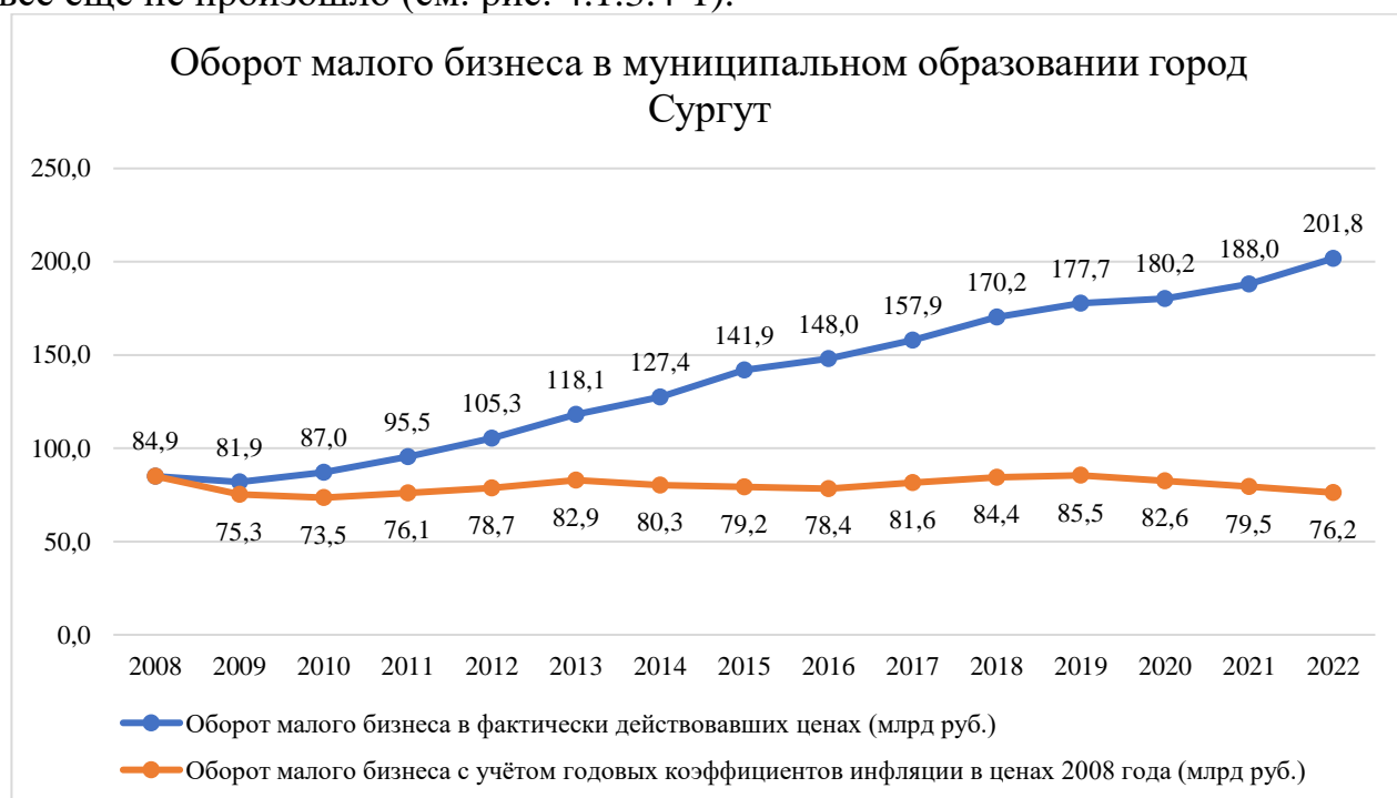
Рисунок 4.1.3.4-1 – Оборот малого бизнеса в муниципальном образовании город Сургут в фактически действовавших ценах и с учётом годовых коэффициентов инфляции в ценах 2008 года, млн руб. 4,5,6,7

Пандемия COVID-19 оказала негативный эффект на малый бизнес в муниципальном образовании город Сургут, в результате чего сократилось как число субъектов, так и оборот малого бизнеса в ценах с поправкой на годовые коэффициенты инфляции. Восстановление после негативного эффекта пандемии всё ещё не произошло (см. рис. 4.1.3.4-1).