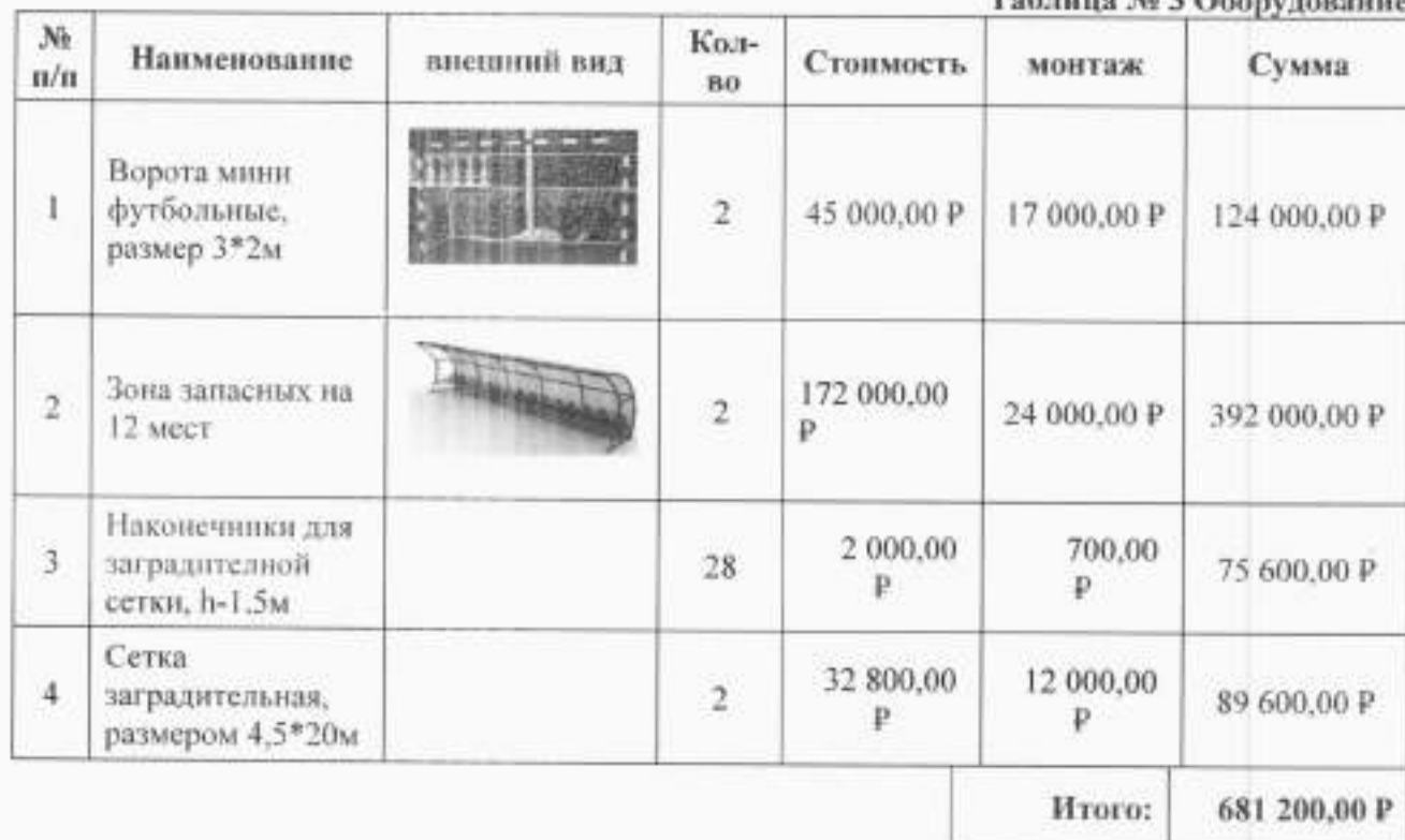
Таблица № 3 Оборудование

Все расчёты произведены без учета расчетов с НДС.