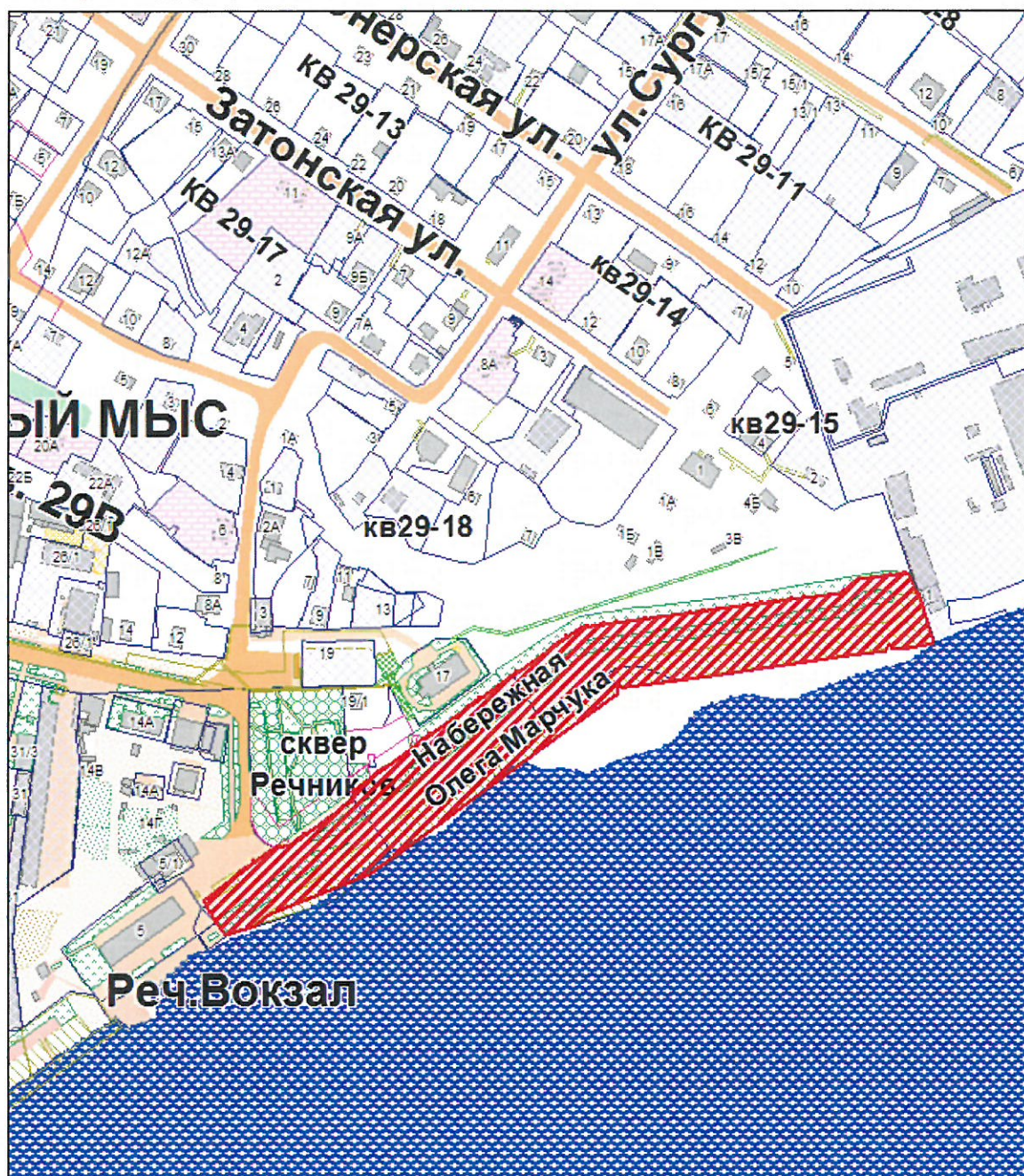
Схема расположения земельного участка под берегоукрепление от пассажирского вокзала до речного порта в г. Сургуте (1-ая очередь строительства), расположенного в районе речного вокзала, в г. Сургуте, общей площадью 18 556 кв.м.