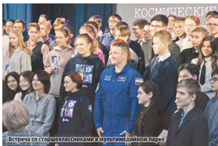
Встреча со старшеклассниками в мультимедийном парке