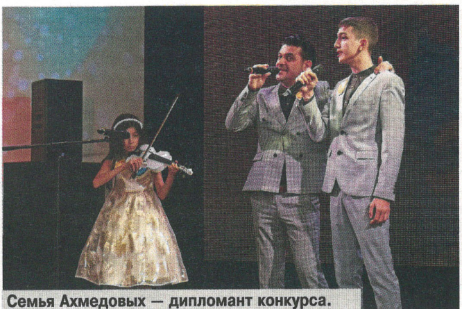
Семья Ахмедовых — дипломант конкурса.