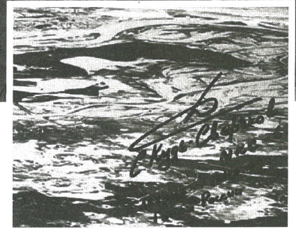
Так выглядит г. Сургут с расстояния 1500 км от Земли

Профессия космонавта – мечта чуть ли не каждого ребенка, а в Сургуте к космическим мечтам молодежь относится серьезно. Так, в школе № 9 и Сургутской технологической школе в собственных