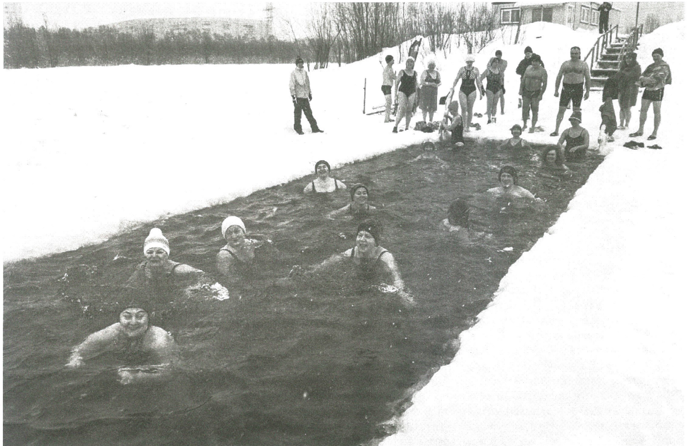
В Сургуте десятки лет обсуждают, где и как расположить городской пляж. А он уже давно есть: в северном городе с коротким летом куда актуальней зимнее плавание

«Моржи Сургута» могут сохранить свою базу и вписаться в зону элитного ЖК, но нужна помощь застройщика и мэрии