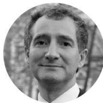
Олег Щербачёв, предводитель Российского Дворянского собрания