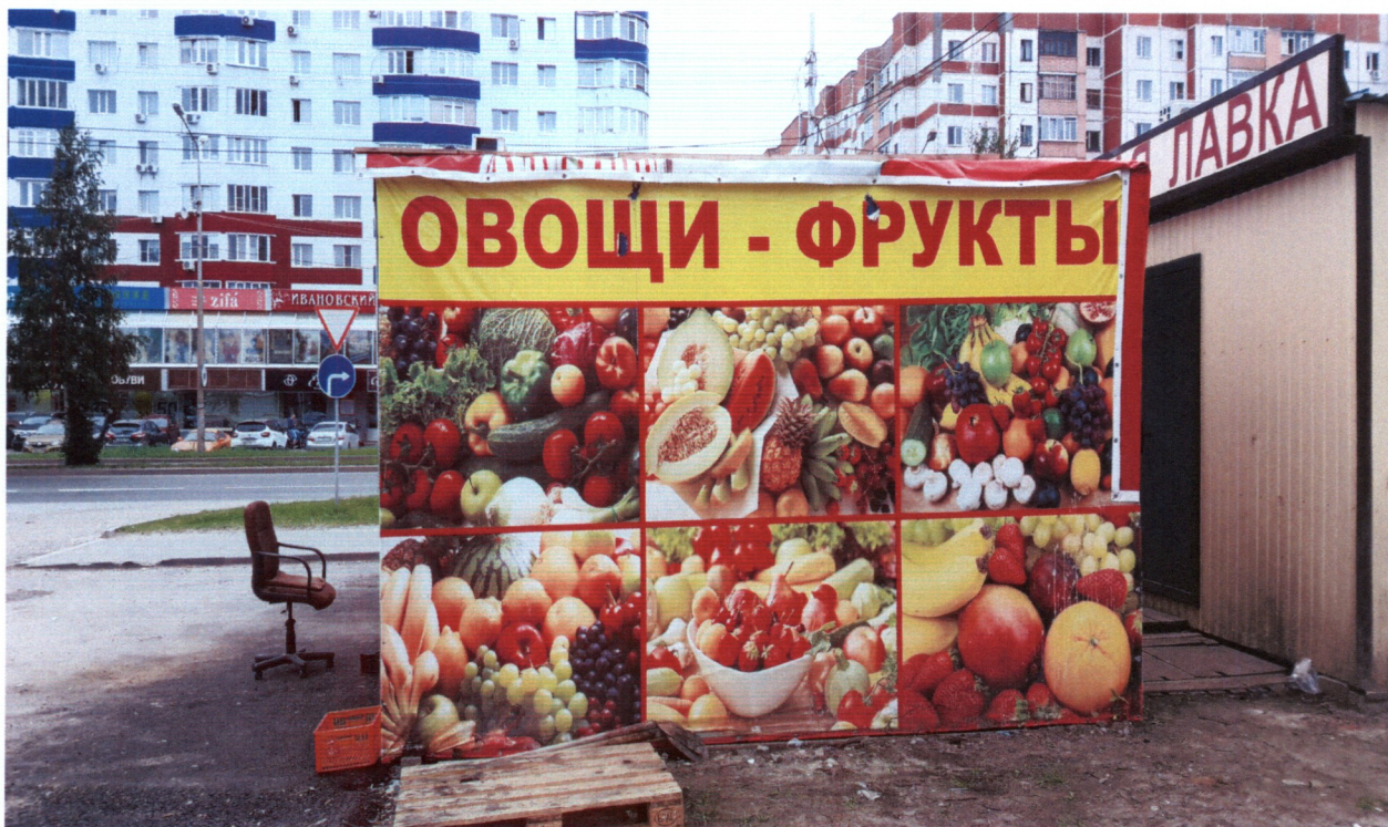
Фото нестационарного торгового объекта «ОВОЩИ-ФРУКТЫ», расположенного по адресу: г. Сургут, проезд Мунарева