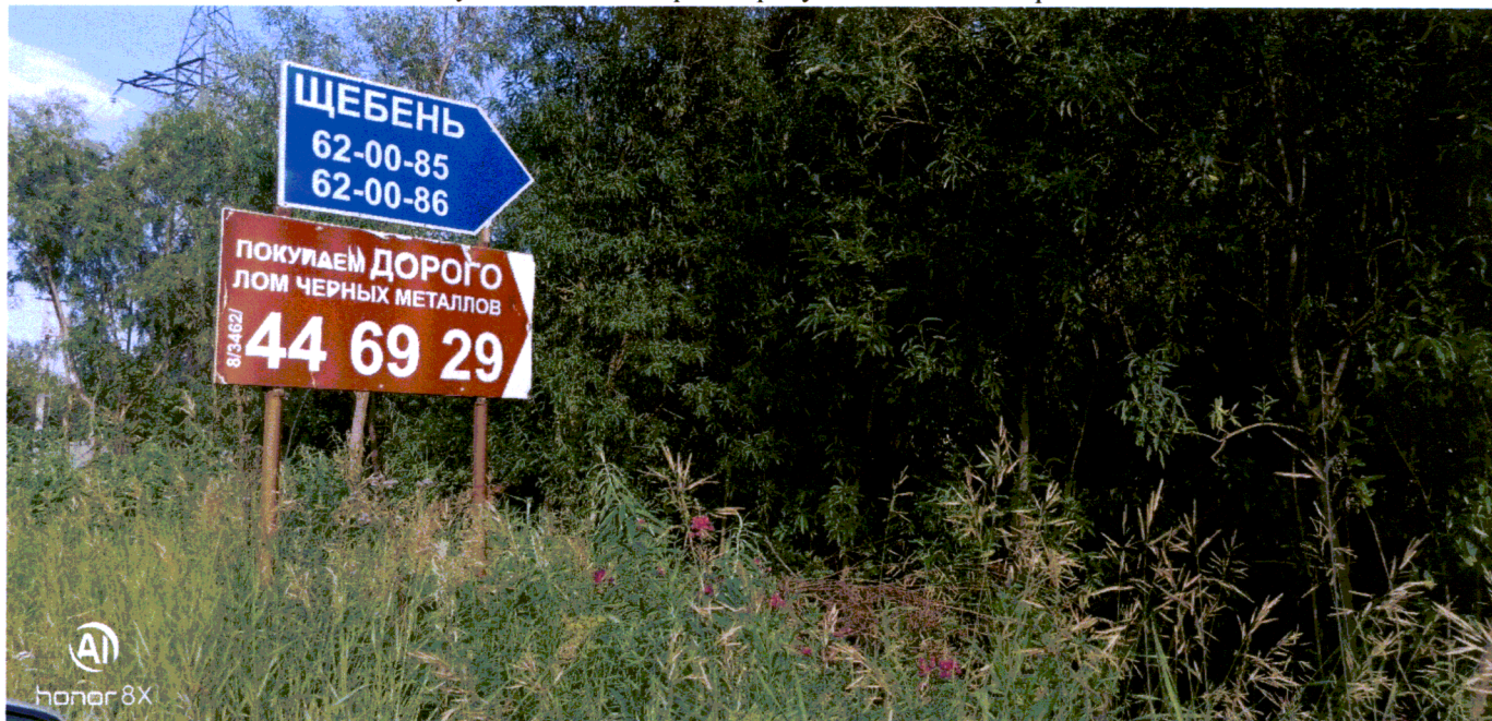
Фото 5 ул. Сосновая через дорогу от здания 29 строение 2

Съёмка проводилась в 17 часов 42 минут телефоном Xiaomi Redmi Note 9 PRO