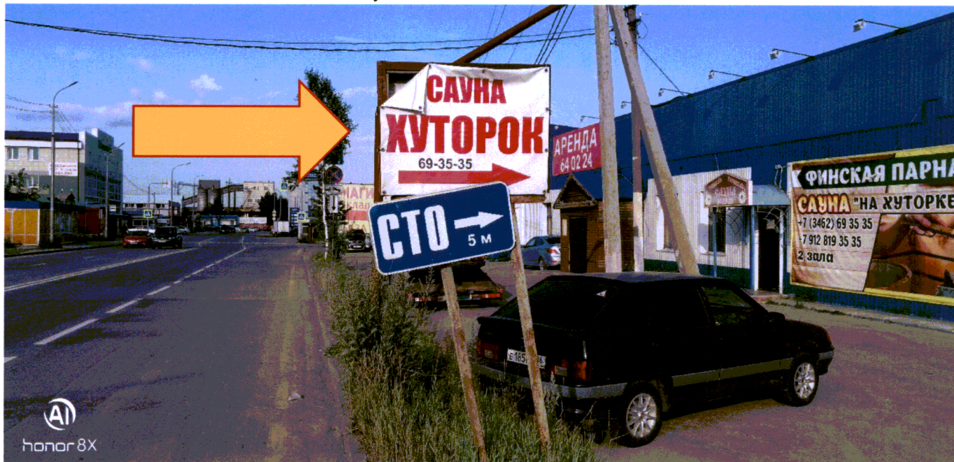
Фото 3 ул. Сосновая возле здания №6/2

Ведущий специалист административного контроля контрольного управления Администрации города