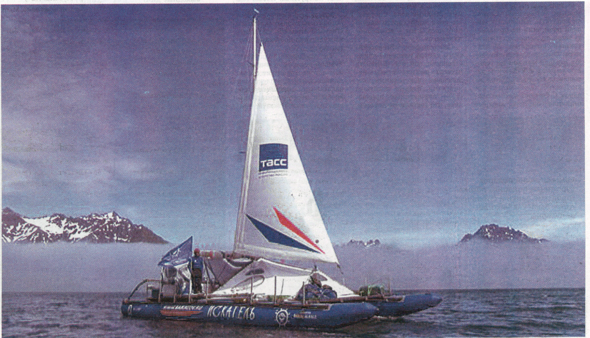
«Искатель» идет под парусами вдоль побережья Аляски