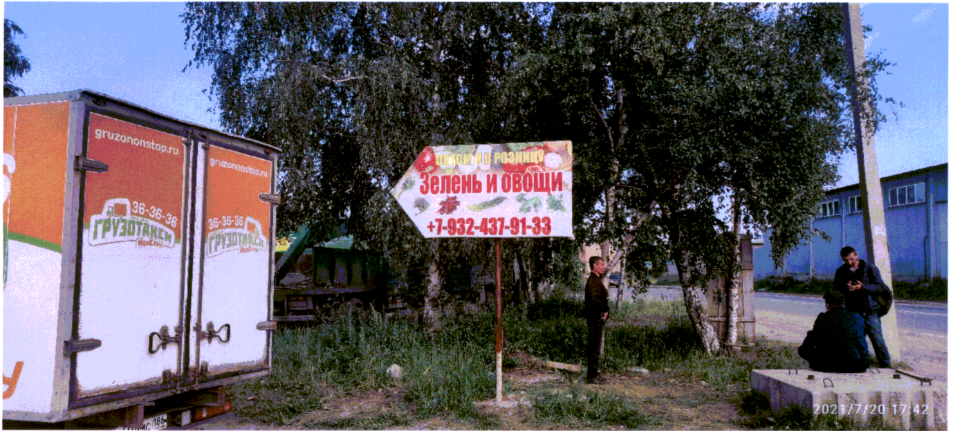
Фото 1 ул. Сосновая в районе здания №5

Съёмка проводилась в 17 часов 42 минут телефоном Xiaomi Redmi Note 9 PRO