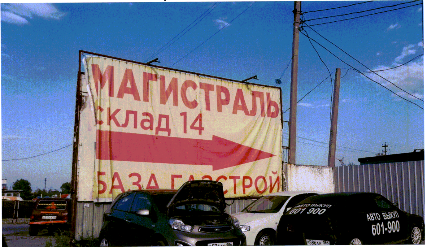
Фото 4 ул. Сосновая возле здания №6/2

Ведущий специалист административного контроля контрольного управления Администрации города