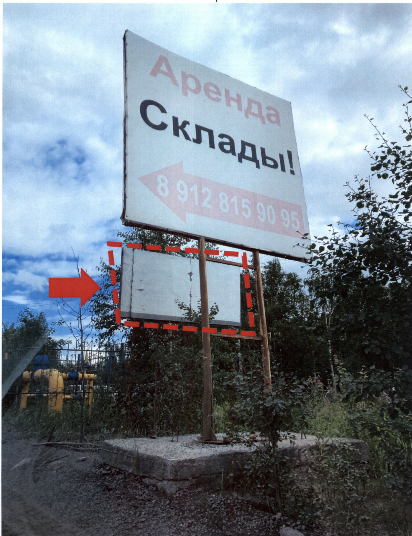
Фото 1 сторона А

Ведущий специалист административного контроля контрольного управления Администрации города