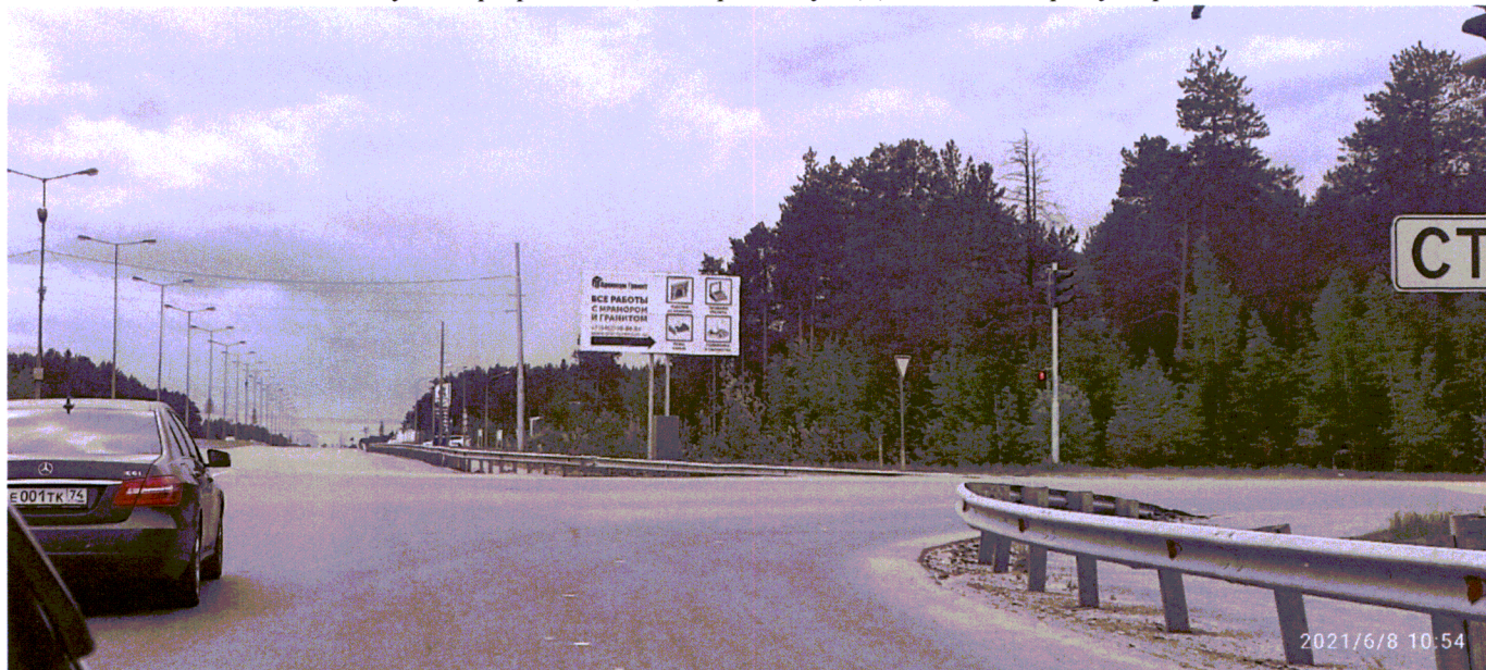
Фото 1 ул. Аэрофлотская, поворот на ул. Дальняя в сторону города

Съёмка проводилась в 10 часов 54 минут телефоном Xiaomi Redmi Note 9 PRO