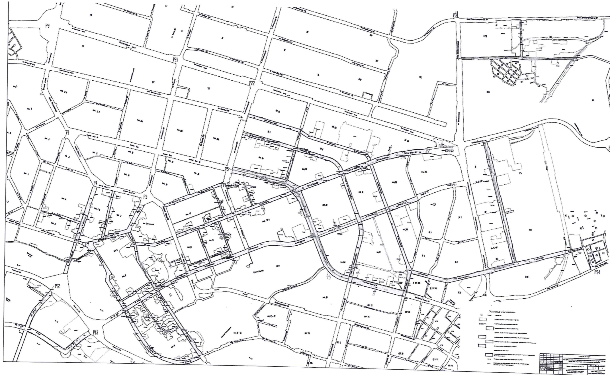
Чертеж межевания территории Лист 1

Об утверждении внесения изменений в постановление Администрации города от 20.07.2015 № 5044 «Об утверждении проекта планировки территории улично-дорожной сети города Сургута» (с изменениями от 20.03.2020 № 1865, 19.12.2017 № 11314, 26.01.2017 № 463) в части проекта межевания и проекта планировки (в части красных линий) территории улично-дорожной сети города (3 этап)