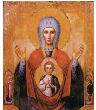
Икона Пресвятой Богородицы Абалацкая