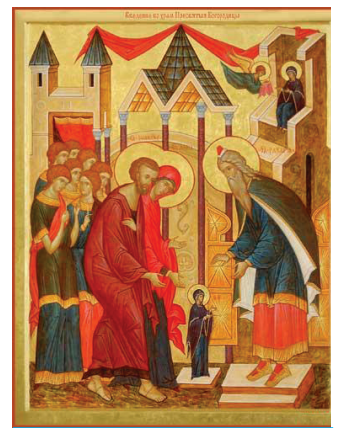
Введение во храм Пресвятой Богородицы