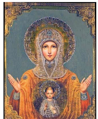
Икона Пресвятой Богородицы Серафимо-Понетаевская