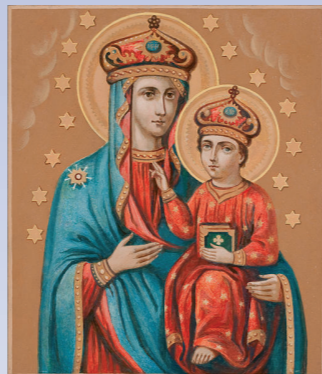
12 ноября - Озерянской иконы Божией Матери (XVI). Главная святыня и покровительница города Харькова.