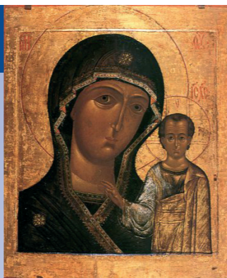
4 ноября - празднование Казанской иконы Божией Матери в память избавления Москвы и России от захвата поляков в 1612 году.