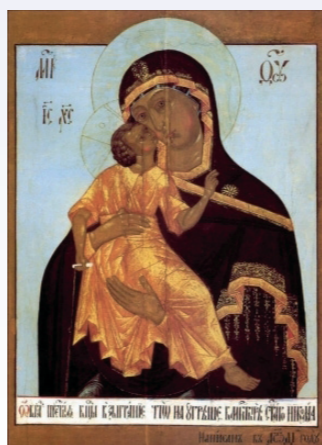
20 ноября - иконы Божией Матери «Взыграние», Угрешской (1795). Список 1814 г. Московский Государственный объединенный музей-заповедник.