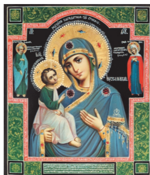
Иерусалимская икона Божией Матери