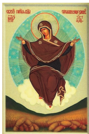
Икона Божией Матери «Спорительница хлебов»

– Да, женщины в основном приходят в храм в юбках, хотя такого жесткого акцента, как у нас, в Европе и в Америке нет. В платочках ходят не все. Нужно сказать, что и греки тоже далеко не все в платочках приходят в храм. У них нет такой традиции.