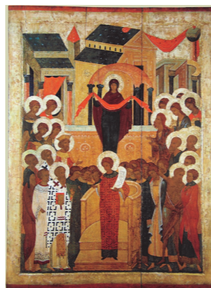
Покров Пресвятой Владычицы нашей Богородицы и Приснодевы Марии