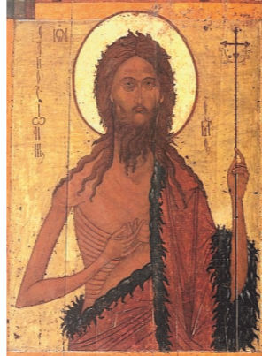
Пророк Иоанн Предтеча