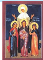
Мцц. Вера, Надежда, Любовь и мать их София