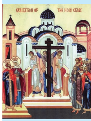
Воздвижение Креста Господня