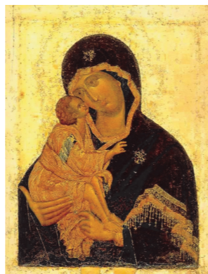
Икона Божией Матери Донская