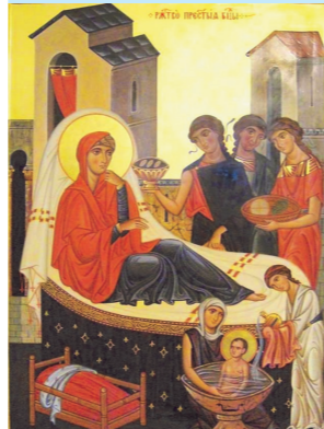
Рождество Пресвятой Богородицы