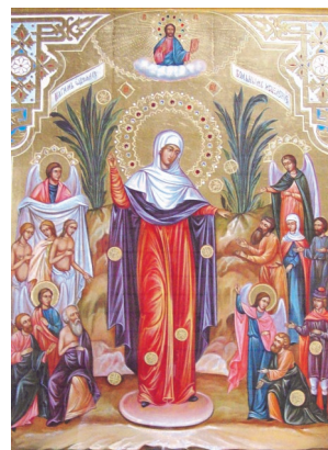
Всех скорбящих радость (с грошиками)