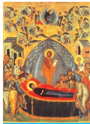
Успение Пресвятой Владычицы нашей Богородицы и Приснодевы Марии