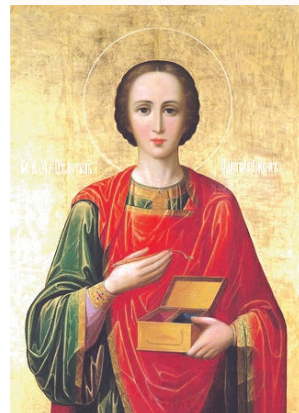
Вмч. и целитель Пантелеимон