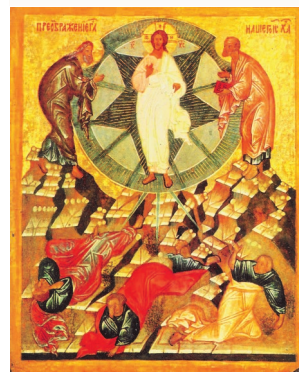
Преображение Господа и Спаса нашего Иисуса Христа