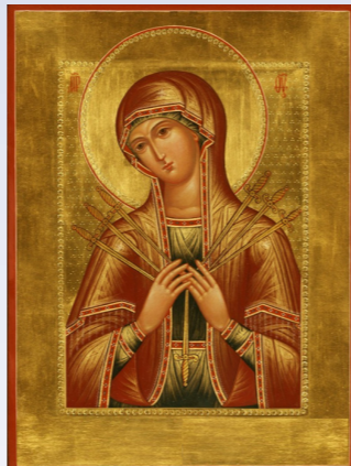
Икона Божией Матери «Умягчение злых сердец».