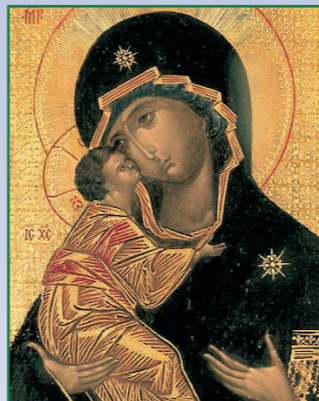
Владимирская икона Божией Матери. Находится в храме Святителя Николая в Толмачах - домовый церкви при Третьяковской галерее, Москва.