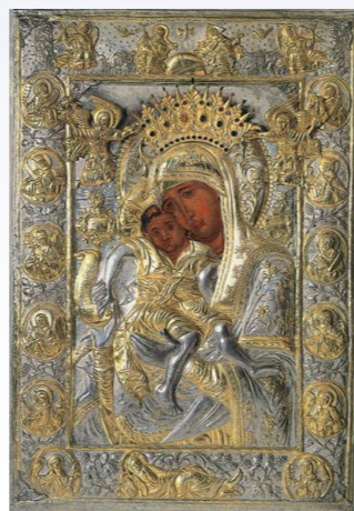
Икона Божией Матери «Достоинно есть», Афон.