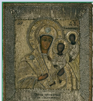
Икона Божией Матери, именуемая «Молченская».