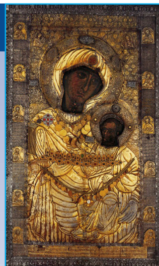
Иверская икона Божией Матери. Монастырь Ивирон, Святая гора Афон.