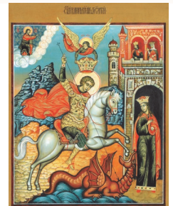
Вмч. Георгий Победоносец