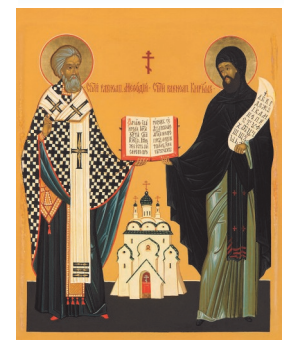
Равноап. Мефодий и Кирилл»