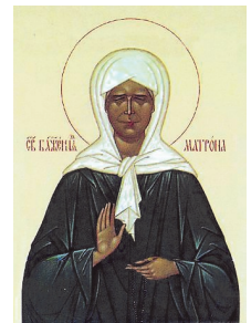
Св. блж. Матрона Московская