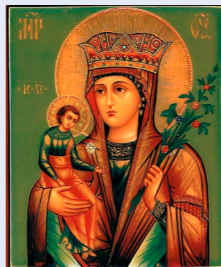
Икона Божией Матери «Неувядаемый Цвет».