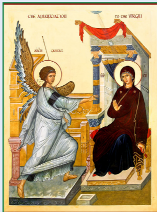
Икона Божией Матери «Благовещение».