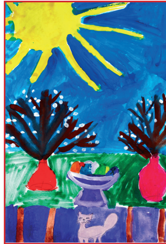
Нелюбина Настя, 7 лет.