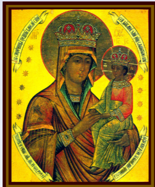
Икона Божией Матери «Споручница грешных»