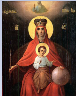
Икона Божией Матери, именуемая «Державная», явилась 2 марта 1917 года в селе Коломенском под Москвой