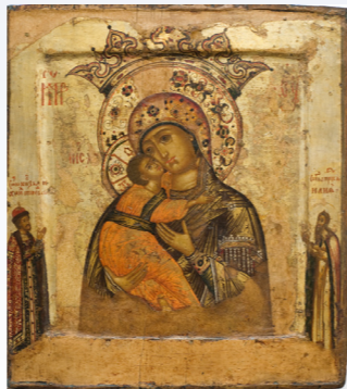
Икона Божией Матери Волоколамская. В обиходнике Иоисифо-Волоцкого монастыря 1578 года эта икона отмечена как чудотворная