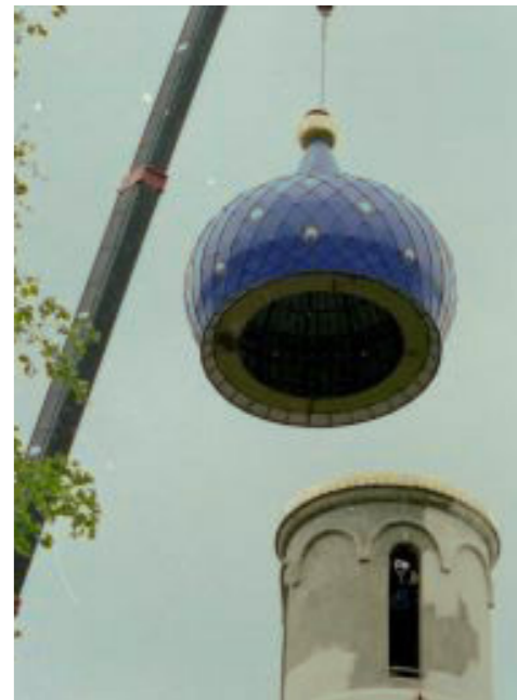
Монтаж главного купола храма. 2002 год.

А теперь я расскажу вам о белой голубке. Когда была закончена кирпичная кладка, отслужили молебен уже внутри храма, и казалось, что уже вот-вот, осталось совсем немного и храм будет готов. Но на самом деле все не так-то просто: стены - большая и наглядная работа, а затем начинаются