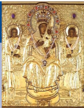
Кипрская икона Пресвятой Богородицы прославилась в селе Стромынь, недалеко от Москвы, в начале 1841 года