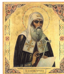
Святитель Ермоген патр. риарх Московский