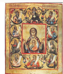
Икона Божией Матери- Курская-Коренная