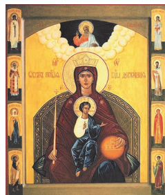
Икона Божией Матери «Державная»