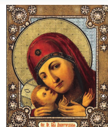
Девпетерувская икона Божией Матери