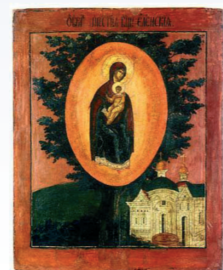
Икона Божией Матери Елецкая-Черниговская.