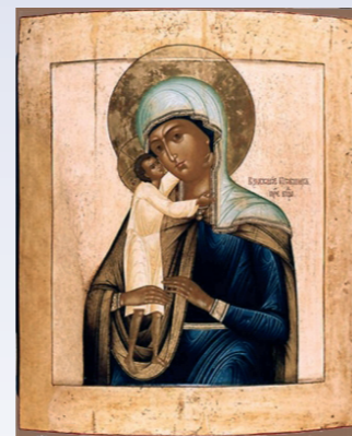
Икона Божией Матери «Взыскание погибших»