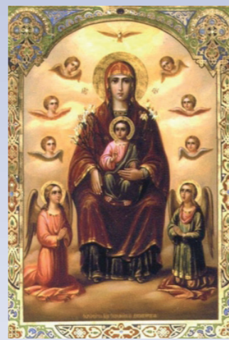
Дивногорско-Сицилийская икона Божией Матери