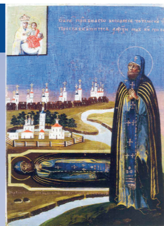
Икона Божией Матери Суморинская-Тотемская прославилась многими чудесами в Спасо-Суморинском монастыре города Тотмы.