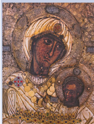
Иверская икона Божией Матери. Вратарница Афона. Монастырь Ивиرون.