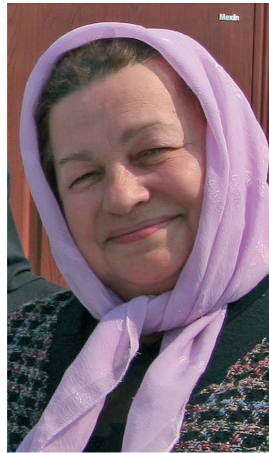
Окончание, начало на стр. 4

шать: шторки, вышитые рушники на иконах, цветы на подоконниках. И сама старалась одеваться красиво, празднично: на меня смотрят люди, говаривала она, и я должна всем своим видом нести им радость.