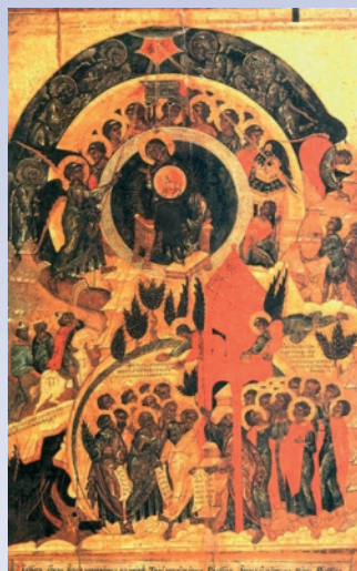
25 января - иконы Божией Матери «Акафистная». XVI в. Государственный исторический музей, г. Москва. В нижней части иконы приведены слова из акафиста Пресвятой Богородице: «Радуйся, яко Агнца непорочна во чреве Твоем упасася. Радуйся, Агнца и Пастыря Мати. Радуйся!».