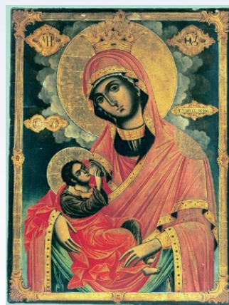
Икона Божией Матери «Млекопитательница». По преданию икона редкой иконографии первоначально находилась в лавре Саввы Освященного, расположенной в 18 верстах от Иерусалима. Сейчас находится на святой горе Афон в Хиландарском монастыре.