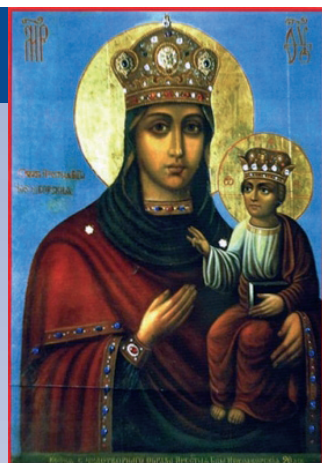
2 января - празднование иконы Божией Матери «Новодворская», икона написана святителем Петром, будущим митрополитом Московским и всея Руси около 1320 года.