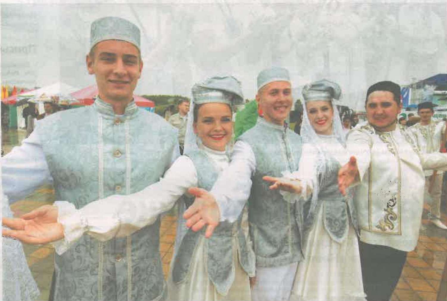
В Сургут из Альметьевска прилетели два чартерных самолета

Что объединяет Сургут и Альметьевск, и зачем жители самого благополучного города России подарили югорчанам Сабантуй