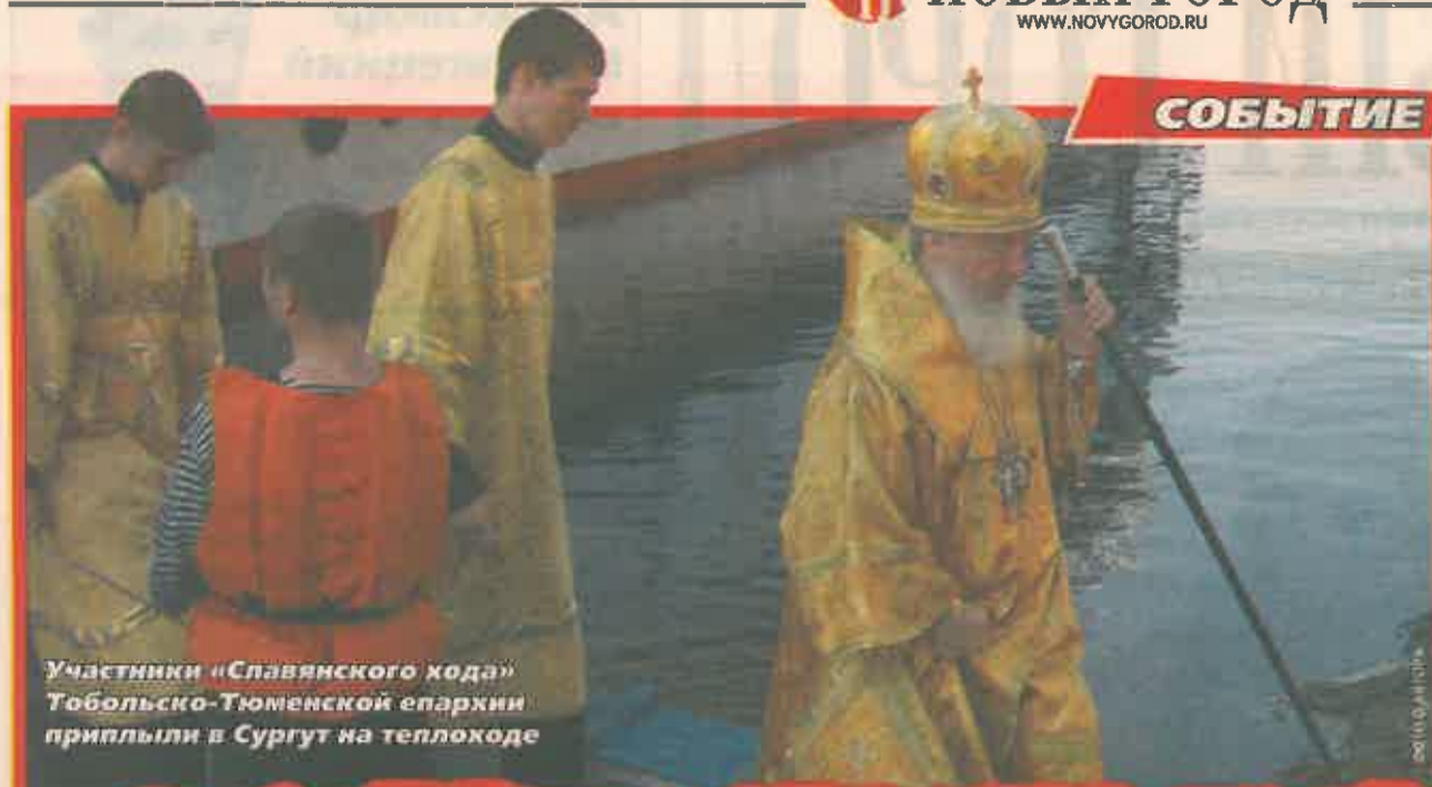
Участники «Славянского хода» Тобольско-Тюменской епархии приплыли в Сургут на теплоходе