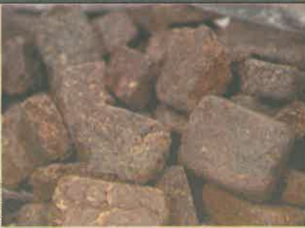
С помощью этих «кирпичиков» строители-наркоторговцы хотели обогатиться

Братья-подельники имели подпольный цех на ул. Республики в ПГСК-80 под скромным названием «Милосердие». Именно в этом подземном гаражном кооперативе подозреваемые с помощью специальных формочек штамповали гашишные плитки. В ходе обыска оперативники также обнаружили и изъяли марихуану и гашиш.