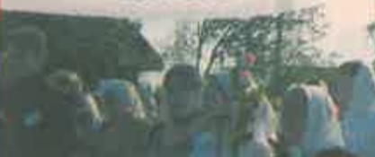
Крестный ход от пристани завершился у храма Преображения Господня