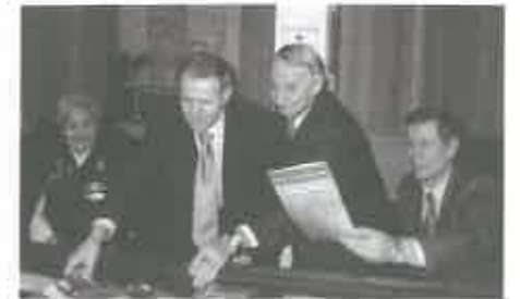
Первооткрыватель с учениками

Переживая вместе со страной социально-по-литические преобразования девяностых годов прошлого столетия, коллектив предприятия со-хранился, трансформируясь по годам, исходя из ситуации по отношению к геологоразведочной отрасли до настоящего времени, не забывая своей истории, не забывая славных трудовых до-стижений, но и не живя только одними прошлыми достижениями. Коллектив сохраняет свой фир-менный почерк выполнять то, что не каждому, как говорится, дано.