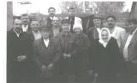
2001 год – у истоков

С каждым годом увеличивается количество разведанных запасов на необъятных просторах России и свой вклад в геологоразведку уже три де-сятилетия, часто без перерывов на завтрак, обед и ужин, а также на отдых вносят люди, которых на-зывают независимо от образования и профессии геологами.