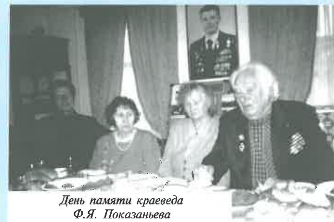
День памяти краеведа Ф.Я. Показаньева