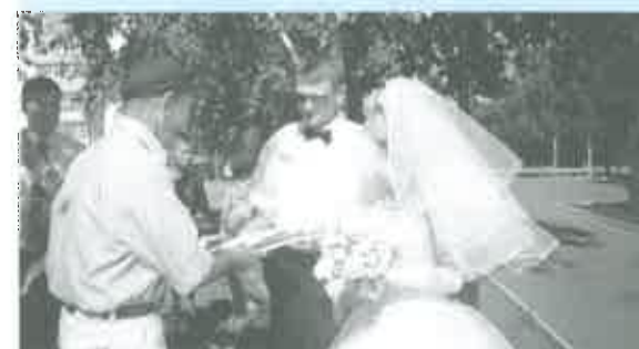
Ветераны войны и труда молодым на память в день свадьбы