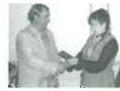
Клуб «Фронтные друзья» из Нефтеюганска с 2004 года