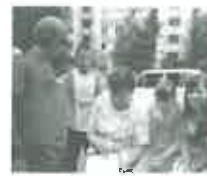
ТОС-10, ТОС-18 с 2004 года