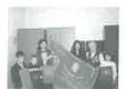
Совет ветеранов-геологов с 2002 года