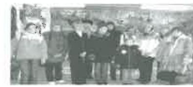
Турфирма «Валерия» с 2006 года