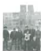
«Пионер» г. Пыть-Ях с 2003 года