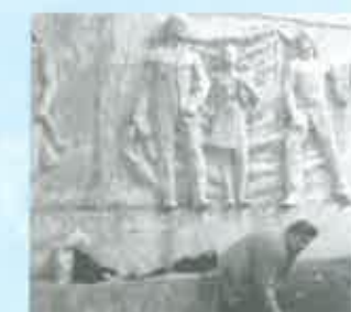
...Здесь должно быть чисто