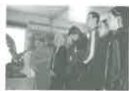
Совет ветеранов мкрн. Центральный с 2002