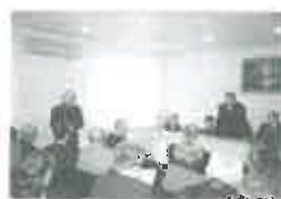
НГДУ «Федоровск-нефть» с 2001 года