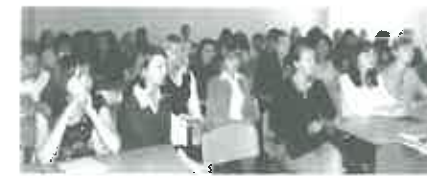
Группа студентов из СГПИ с 2004 года