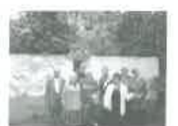
Клуб ветеранов «Ромашка» с 2002 года