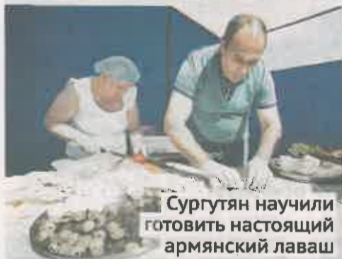
Сургутян научили готовить настоящий армянский лаваш