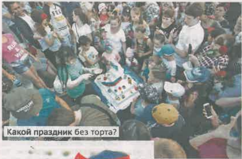
Какой праздник без торта?