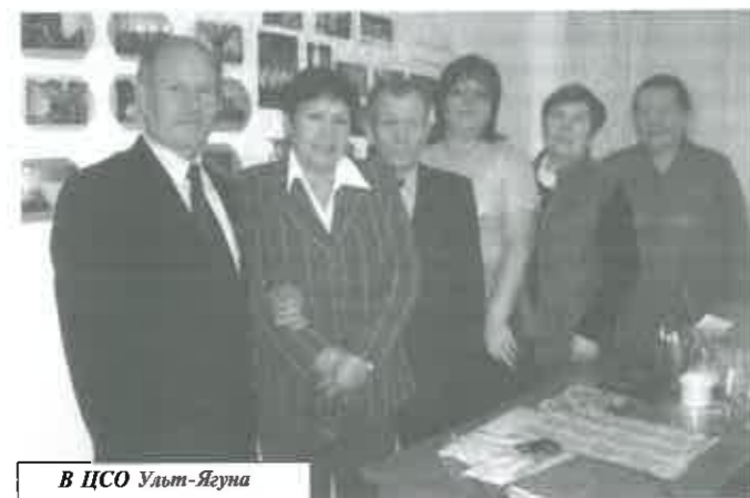
В ЦСО Ульт-Якуна