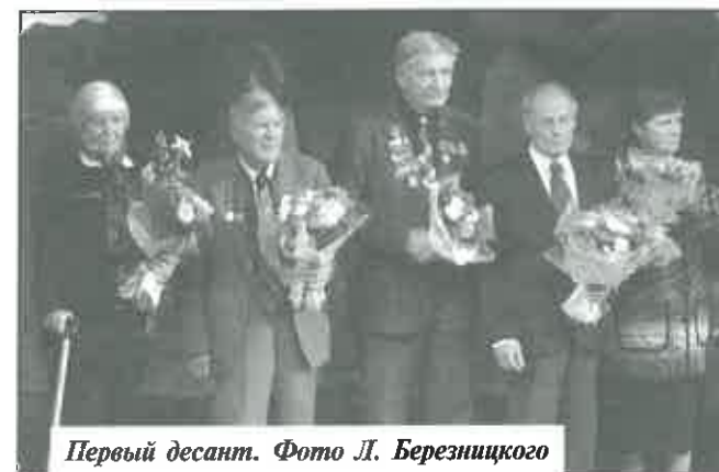
Первый десант.

Всю свою жизнь я трудился в геологии, которая затем разделилась не на