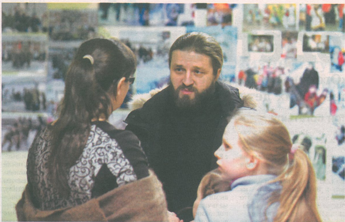
Задача педагога воскресной школы - дать детям знания основ церковных канонов, но главное - помочь сформировать им моральный стержень и сильно полюбить малую родину

св. пророка Ильи. На ней изображены четверо святых, покровителей воинов. Здесь батюшка дает напутствие березовским призывникам.