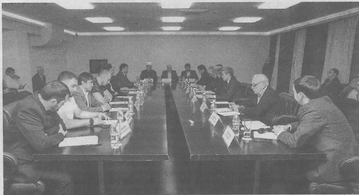
Подобные съезды, где общественники могут обменяться опытом, планируют проводить регулярно

В Сургуте с рабочим визитом побывал советник министра Дагестана