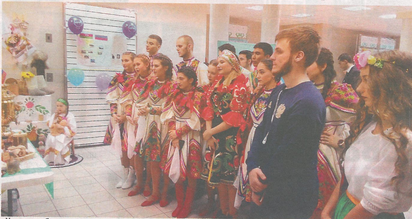
Участники были готовы к проверке своих знаний о народных традициях и обрядах не только теоретически — многие команды приветствовали членов жюри фестиваля «Мы — единый народ» в национальных костюмах