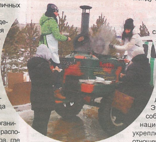
На митинге, предварявшем фестиваль национальных культур в СурГУ, организаторы не давали участникам замерзнуть и угощали их кашей и горячим чаем