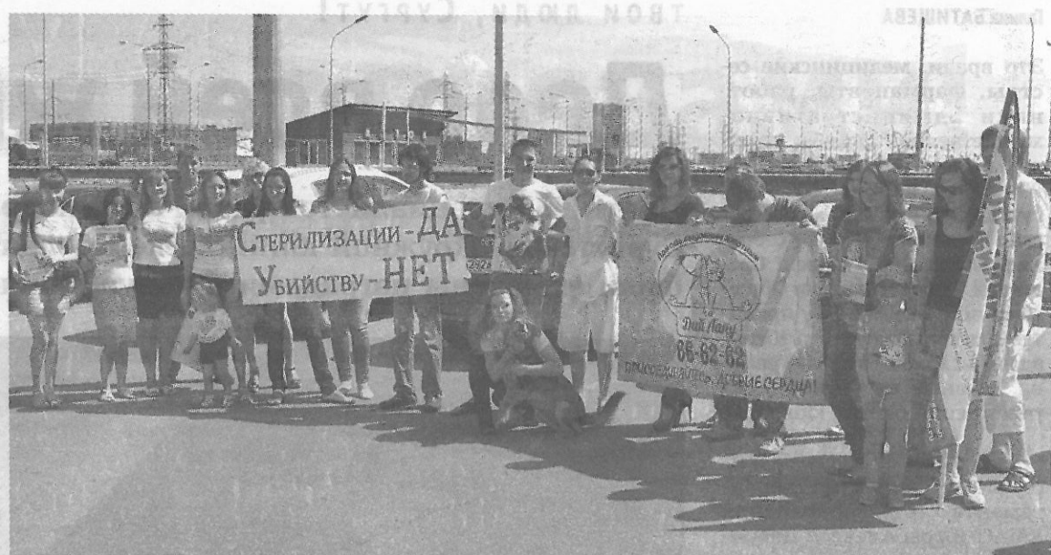
Наработки сургутских зоозащитников используют уже девять регионов России

Формула успешной реализации проекта, разработанная и опробованная волонтерами ОД «Дай лапу», находит применение не только по горизонтальному направлению (среди зоозащитников из других регионов), но и по вер-