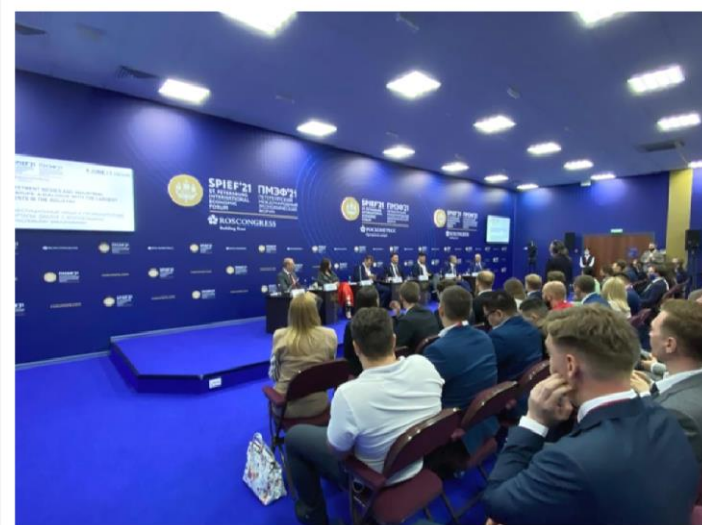
Участие в крупных промышленных Форумах (ПМЭФ, ИННОПРОМ, РИФ и другие