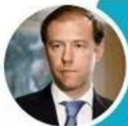
Мантуров Денис Валентинович Министр промышленности и торговли РФ

Состав Попечительского совета утвержден в феврале 2020 года М.В. Мишустинным - Председателем Правительства Российской Федерации утвержден (подписано соответствующее Распоряжение № 403-р от 22.02.2020 г.).