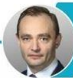
Паршин Максим Викторович Заместитель министра цифрового развития, связи массовых коммуникаций РФ