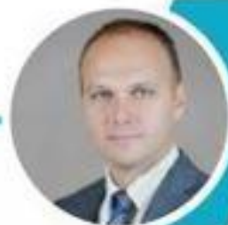
Беспрозванных Алексей Сергеевич Заместитель министра промышленности и торговли РФ