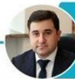
Стасишин Никита Евгеньевич Заместитель министра строительства и жилищно-коммунального хозяйства РФ