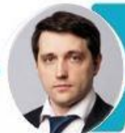
Галкин Сергей Сергеевич Заместитель министра экономического развития РФ