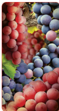
Сторона 1 62x115мм