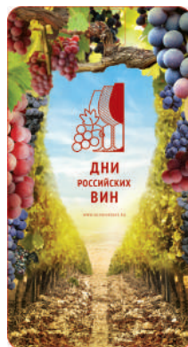
Сторона 2 62x115мм