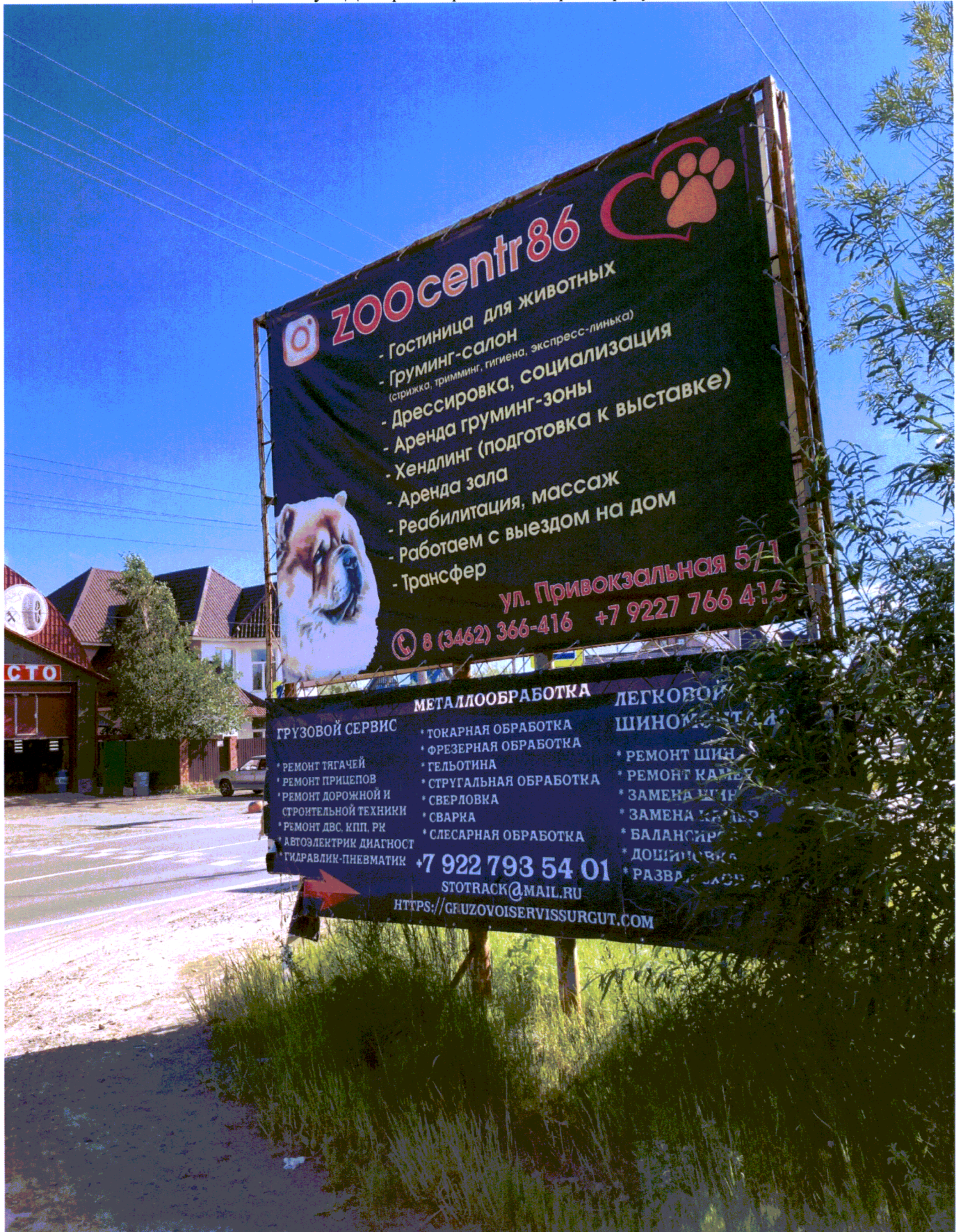
Фото: ул. Дмитрия Коротчаева, через дорогу от дома №40

Ведущий специалист административного контроля контрольного управления Администрации города