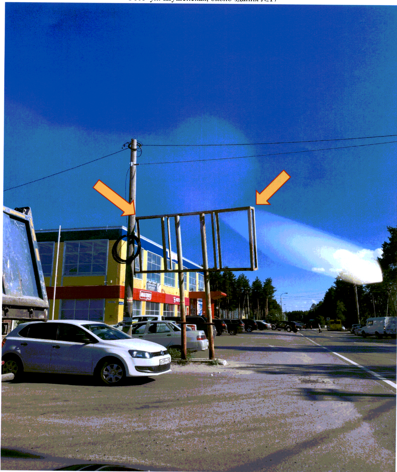
Фото ул. Шушенская, около здания №17

Ведущий специалист административного контроля контрольного управления Администрации города