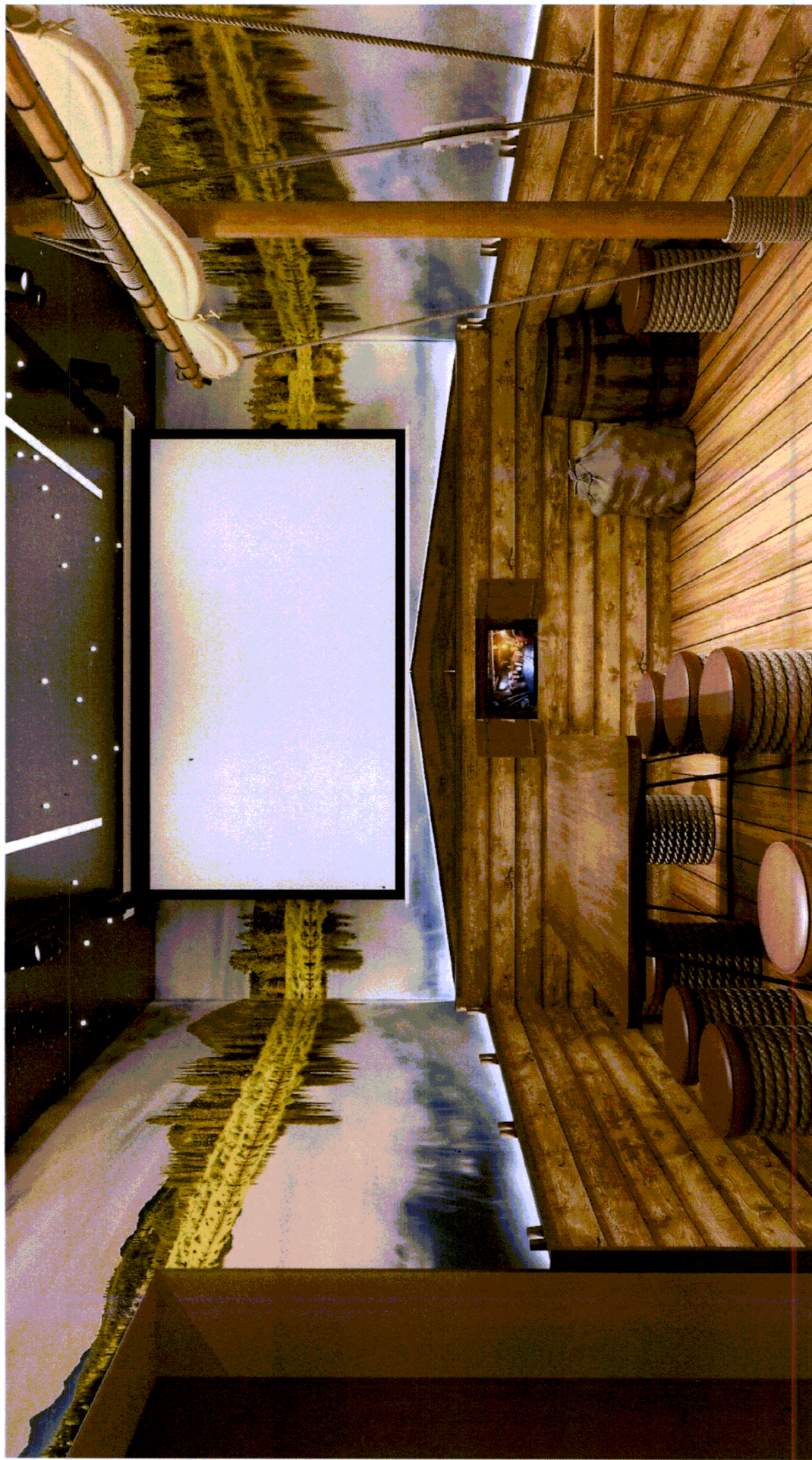
Пример экспозиционного пространства «Путь в Сибирь»