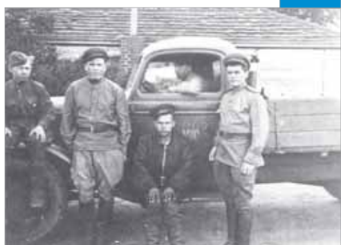
Солдаты Великой Отечественной