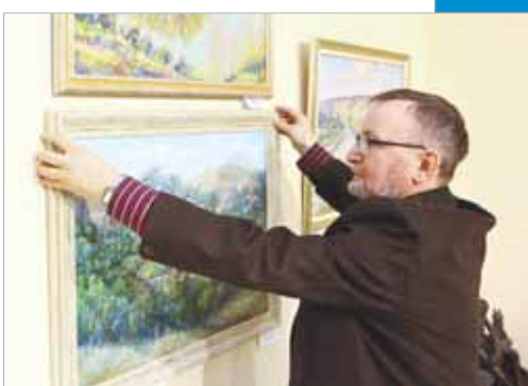
Сургут в теплых тонах