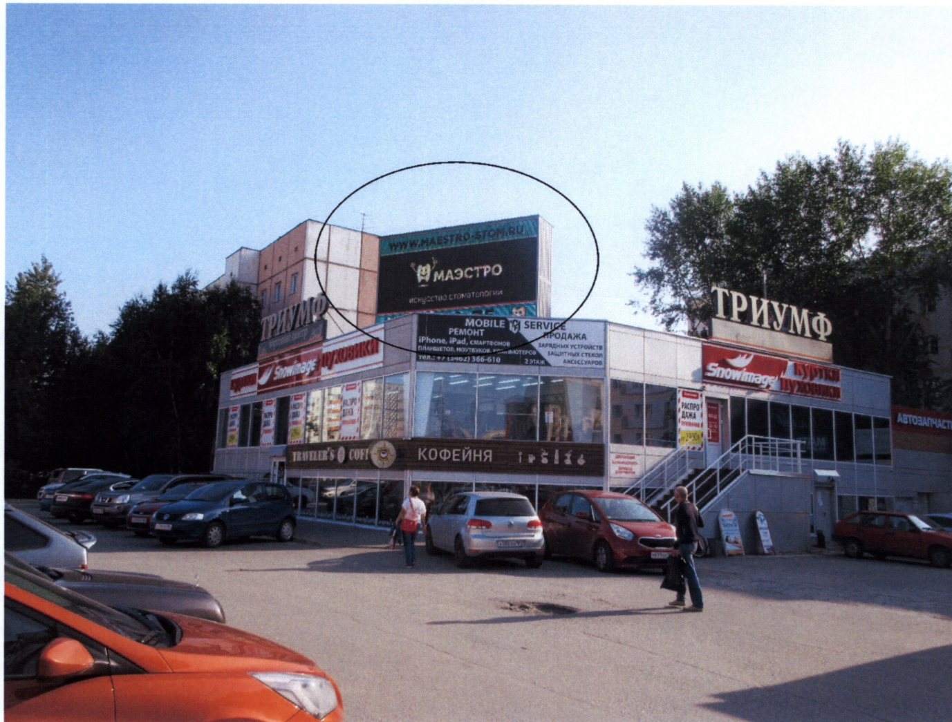
Фото № 2