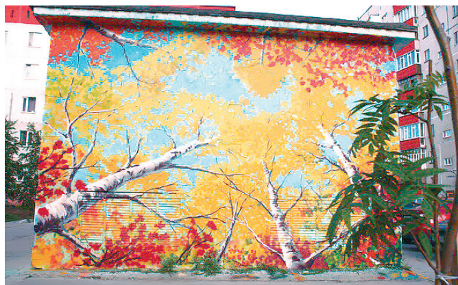
Неказистый коммунальный объект можно превратить в произведение искусства, считают в творческом центре «Сойка»

По заказу Администрации города Сургута в рамках реализации муниципальной программы «Профилактика правонарушений и экстремизма в городе Сургуте на 2014–2030 годы»